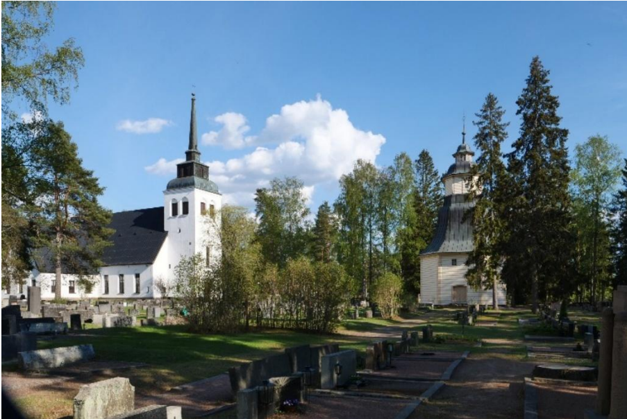
Valkealan kirkko ja kellotapuli.