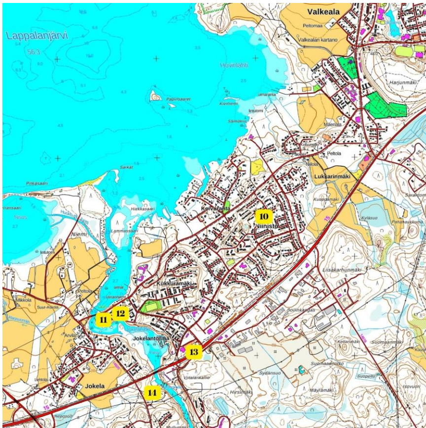
Niinistön ja Jokelan kohteet. Maanmittauslaitos Karttapaikka