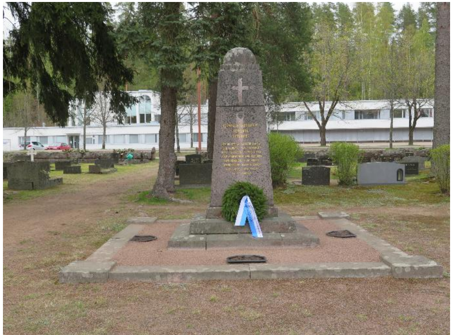
Vapaussodan Valkealan valkoisten muistomerkin pystytti Valkealan kunta v. 1921.