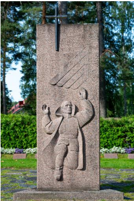
Sankarihautausmaan muistomerkki

Kirkot ja haudat ovat ajan saatossa vaihtuneet, mutta useat vanhat kiviset muistomerkit tulevat säilymään: Sankarihaudoissa lepää vuosien 1939-1944 sodissa kaatuneiden 256 sotilaan hauta. Kolmisivuiseen muistomerkkiin on kuvattu sotilas, äiti ja lapsi sekä kylväjä.