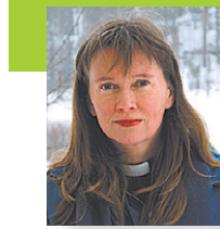
Minna Tanska kappalainen Jaalan kappeliseurakunta